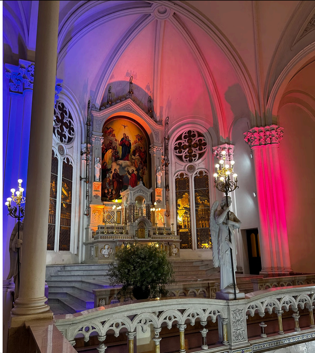
Imagen: Camarín de la Virgen, luego de la intervención

Declarada Obra Singular, Categoría A, Grado de Protección 1b.